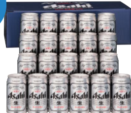
アサヒ スーパードライ 缶ビールセット