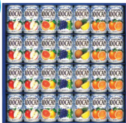
フルーツジュースギフト