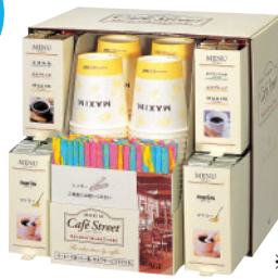
マキシムカフェストリート ※100杯分