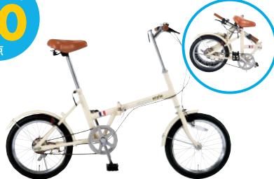
折畳自転車 フレンチバニラ