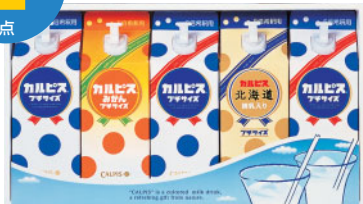
カルピスプチサイズギフト