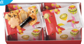
六楽(りくらく) ※あられ